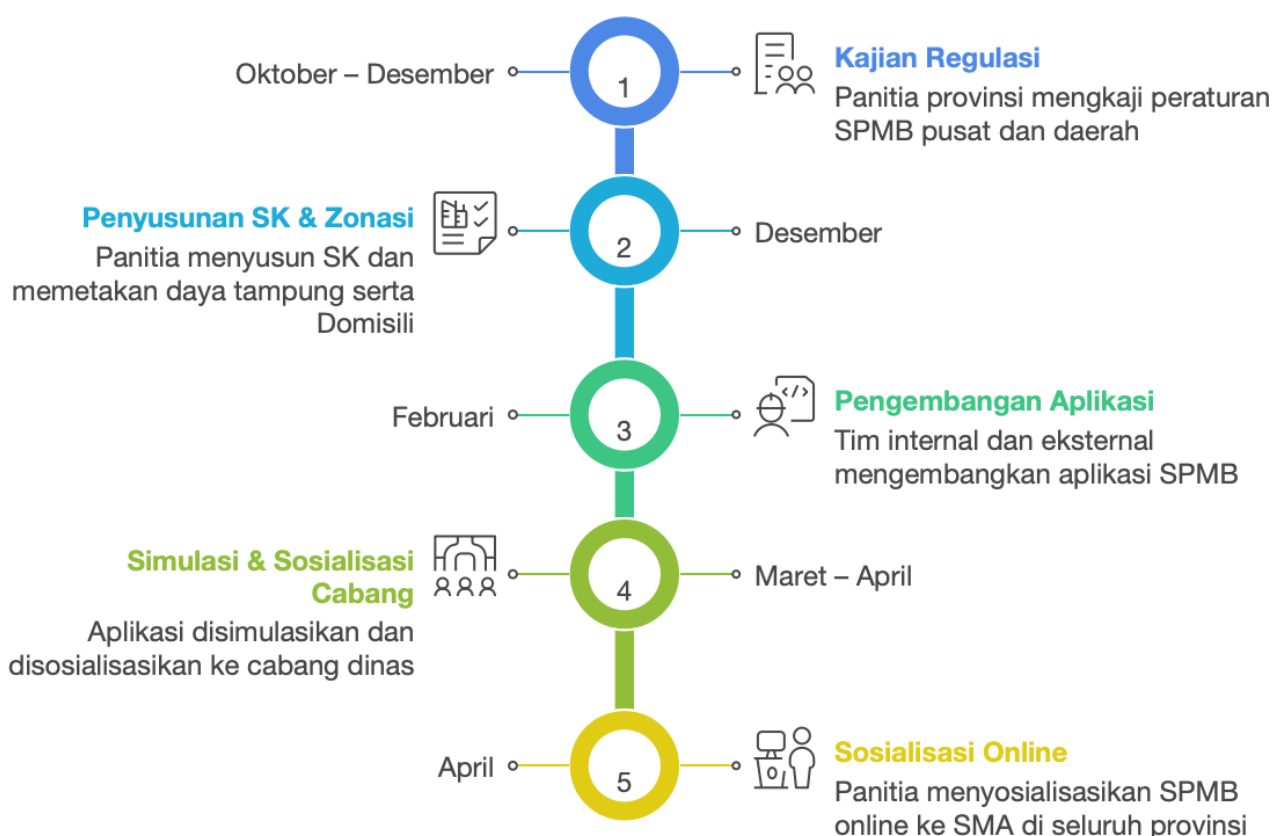
Tabel 2. Kegiatan Pelaksanaan SPMB